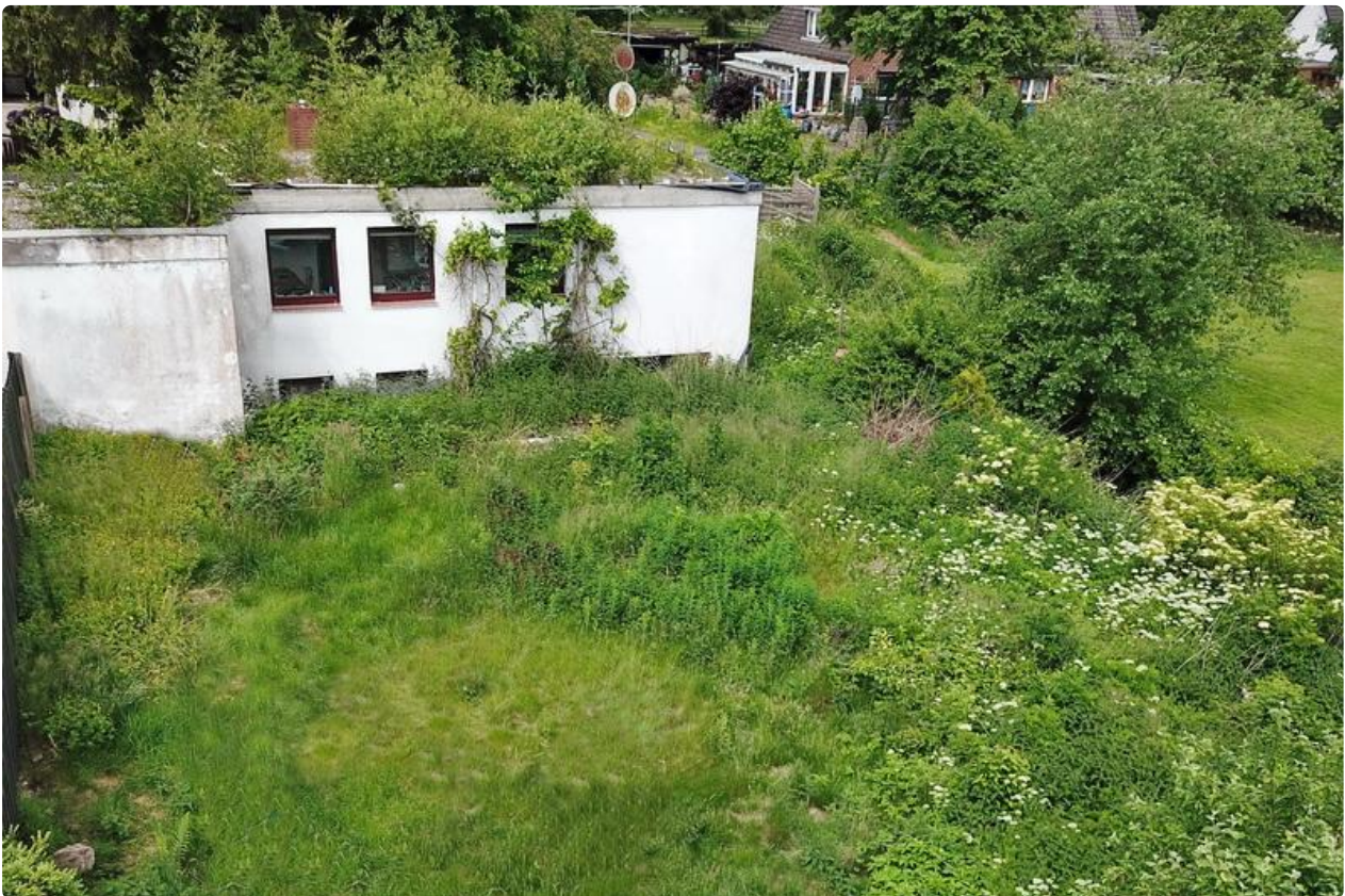
Grundstücksansicht mit Altbestand