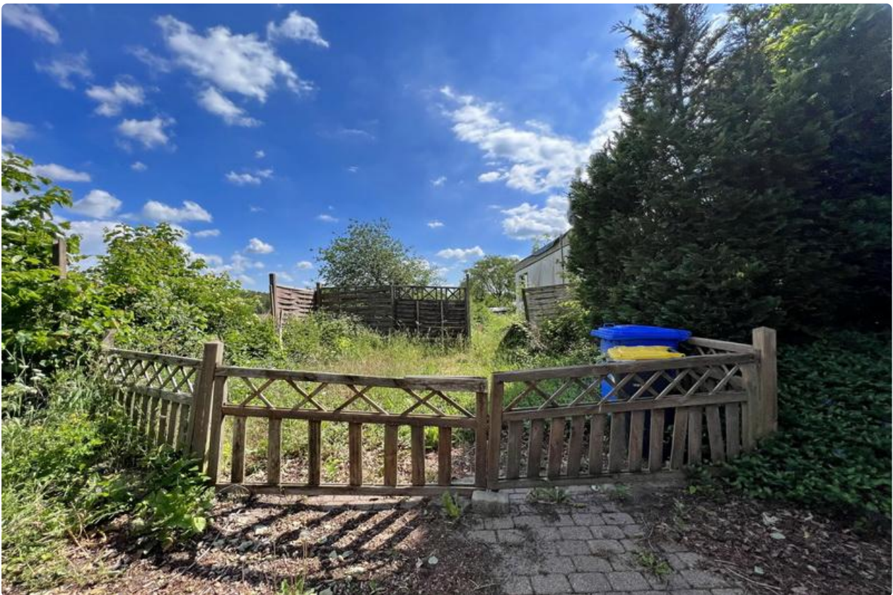
Eingang in den Garten