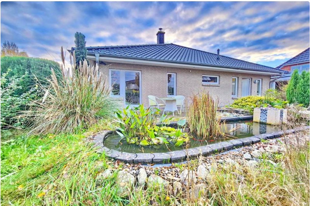
Rückansicht mit Teich